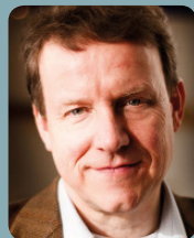
Dr. Schoemaker Werkgemeen- schappen