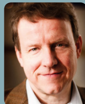
Dr. Schoemaker Werkgemeen- schappen